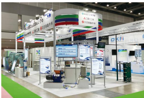
3社合同ブース全景

今後も技術力を生かした製品開発を通じて海事分野の課題解決に貢献してまいります。引き続きご支援を賜りますようお願い申し上げます。